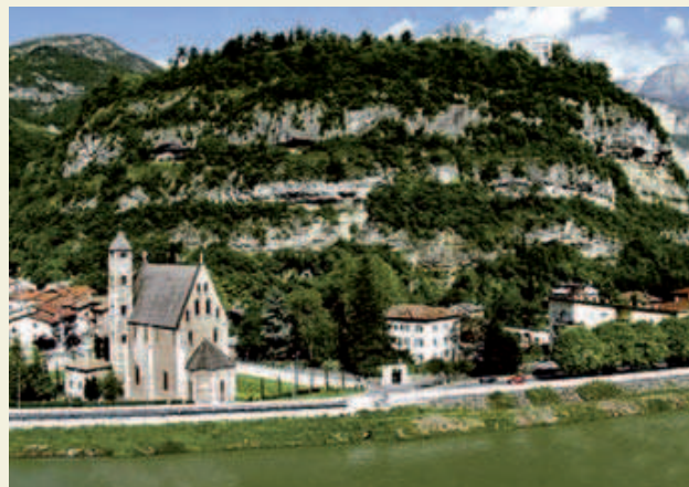
Chiesa S. Apollinare e Dos Trento