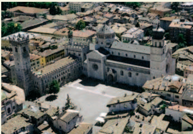
Panorama Piazza Duomo